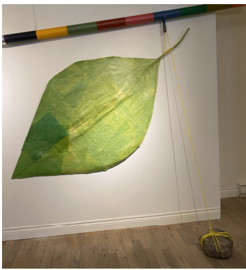
COZIC | Bras dessus, bras dessous Couleur et matière en accord