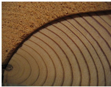
La passion du bel ouvrage Les Compagnons du Devoir