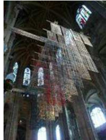
LA ROBE CATHÉDRALE

«Ma démarche commence avec des images de la nature et de l'imagination. Je parle de la tête de l'artiste, de la germination, [...] j'adore Goethe. La métamorphose des plantes, c'est comme nous ... et le processus créateur...»