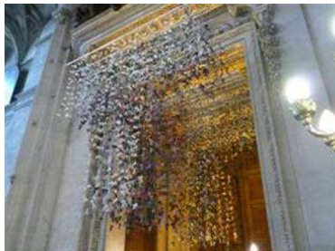
LA ROBE DES NATIONS

samedi 19 avril à 15 h – causerie avec l'artiste Carole SIMARD-LAFLAMME L'imaginaire entre ciel et terre dans le cadre de CULTIVEZ LE JOUR DE LA TERRE